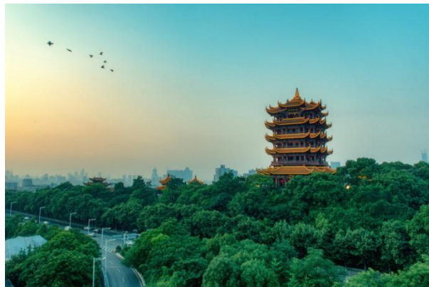
黃鶴樓：唐朝詩人李白在此寫下“孤帆遠影碧空盡，唯見長江天際流”之千古絕唱

武漢是千湖之省——湖北省的省會，是承東啟西、連南接北、九省通衢的交通樞紐。武漢天河機場與宜昌、恩施、襄陽、武當山、神農架機場互補，高鐵樞紐，高速縱橫，交通極為便利。2019年第七屆世界軍人運動會在此舉行，城市風景獲世界好評。這裡有享譽全國的自然和人文景觀，還有人才濟濟的高校林立。