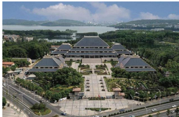
地處東湖之濱的湖北省博物館：收藏了曾侯乙編鐘及勾踐劍等二十餘萬件著名藏品