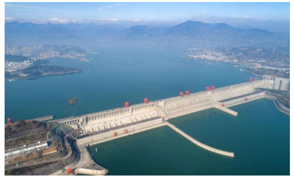
全球最大的水利發電工程-三峽大壩 (宜昌)