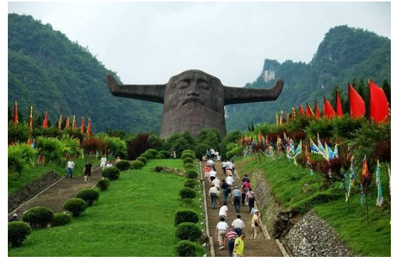
炎帝故里-神農架 (隨州)